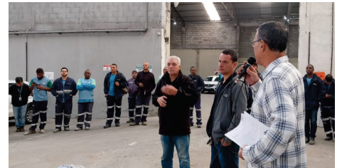
Base Campo Grande